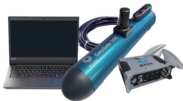
湿端声呐（内置姿态仪，图示为固定式） 干端（便携电脑、甲板单元）

GeoSideScan显控软件实时进行声呐控制、数据采集、目标标记、目标管理、图像显示以及数据网络传输。目标标记、目标管理等功能有效对目标进行记录，实时数据传输方便第三方软件实时接入声呐数据，进行系统融合，转存的标准XTF格式文件方便作业人员应用第三方软件进行数据处理。