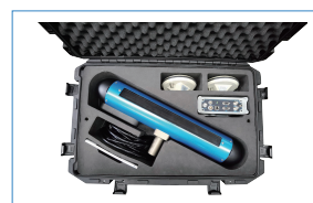
< 包装箱图 >